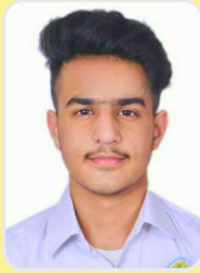
स्वास्तिकः जैनः X-D