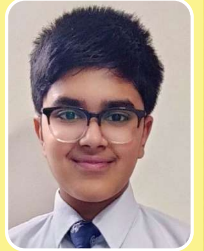
आरवः पराशरः VII-C