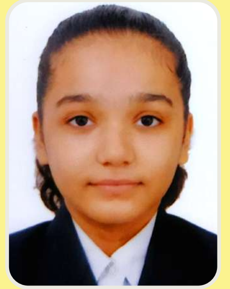
ब्राह्मी देबरानी X-D